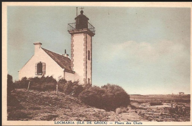
LOCMARIA (ILE DE GROIX) — Phare des Chats